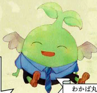
わかば丸 新川高校マスコット